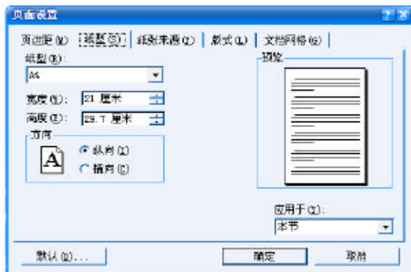
图 1 纸型设置

页边距：上空 3 cm，下空 2.5 cm，左空 1.8 cm，右空 1.5 cm；页眉：上空 2.5cm，见图 2。